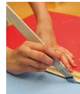
Bau- und Metallmaler