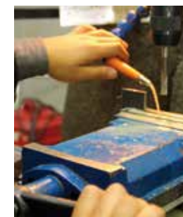
Fachpraktiker für Metallbau